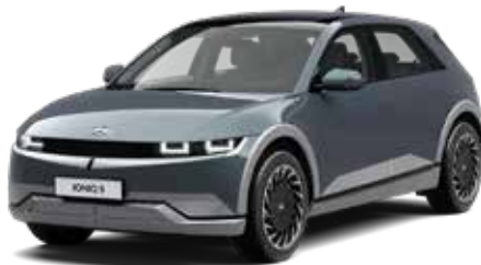
Digital Teal-Green Pearl Mica + € 895