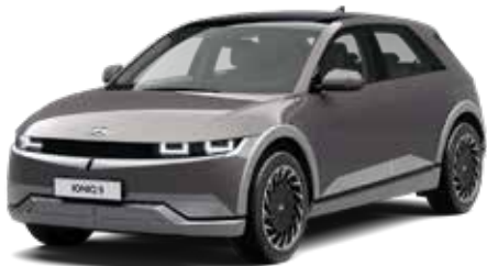
Mystic Olive-Green Pearl Mica