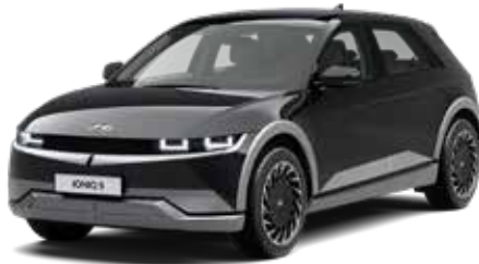
Phantom Black Pearl Mica + € 895