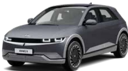
Shooting Star Gray Matte + € 1.095