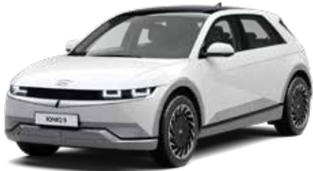
Atlas White Solid + € 695