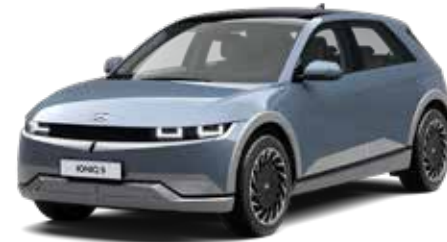
Lucid Blue Pearl Mica + € 895