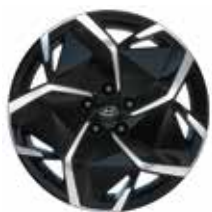
19-inch lichtmetalen velg