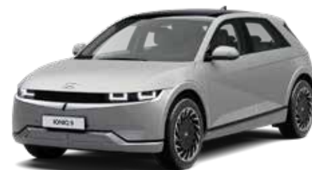
Gravity Gold Matte + € 1.095