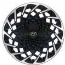
20-inch lichtmetalen velg