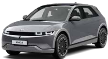
Galactic Gray Metallic + € 895