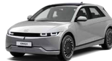
Cyber Gray Metallic + € 895