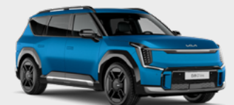
Ocean Blue Matte → matte lak Kleurcode: OBG