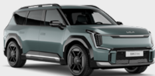
Ocean Blue Kleurcode: